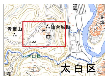
← 約500m → M3