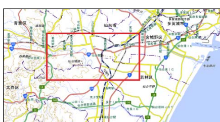
← 約10km → M6